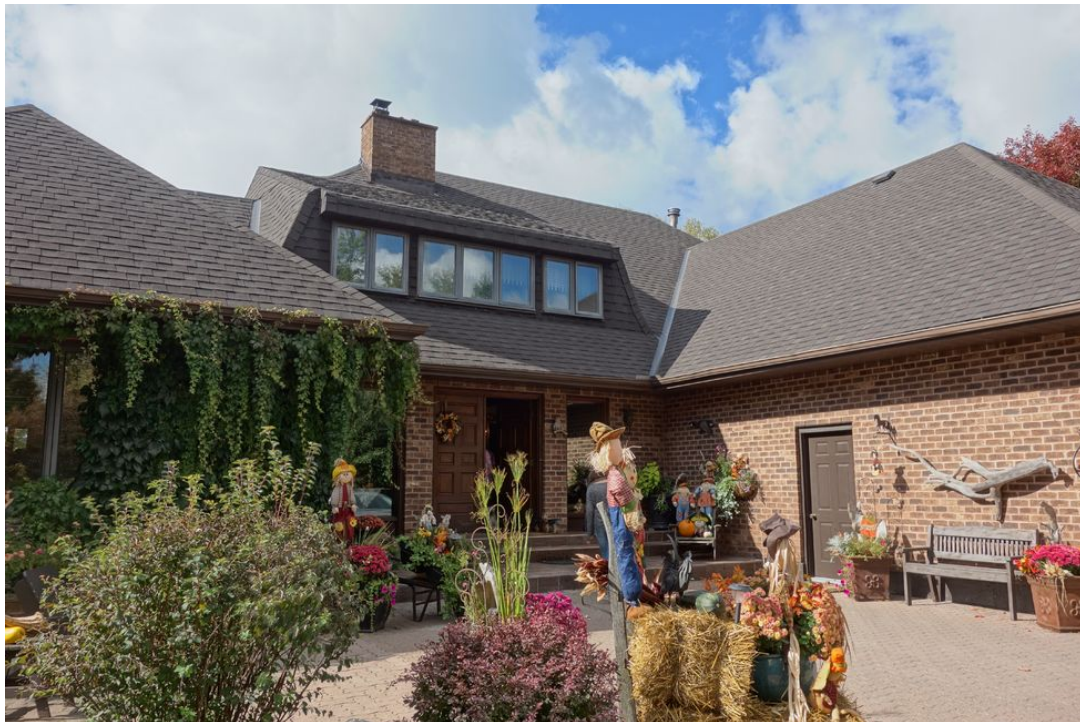
Abb. 03 Ansicht Nordseite - Haupteingang