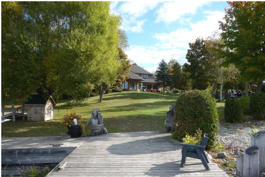
Abb. 04 Nur ein paar Schritte vom See zum Haus