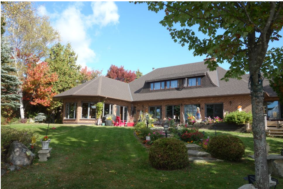
Abb. 02 Ansicht Südfassade