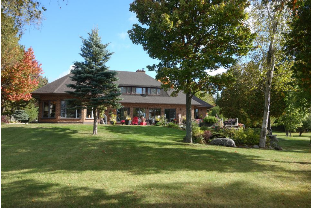
Abb. 01 Parkanlage mit gepflegtem Baumbestand