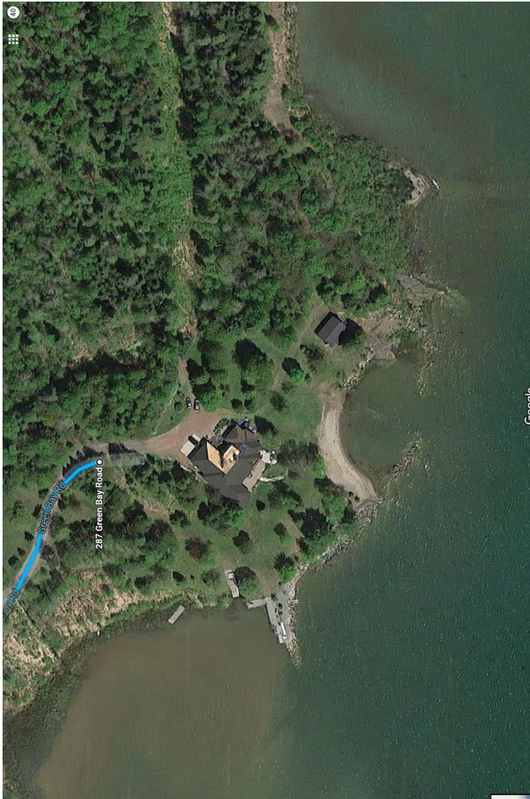
Abb. 11 Karte