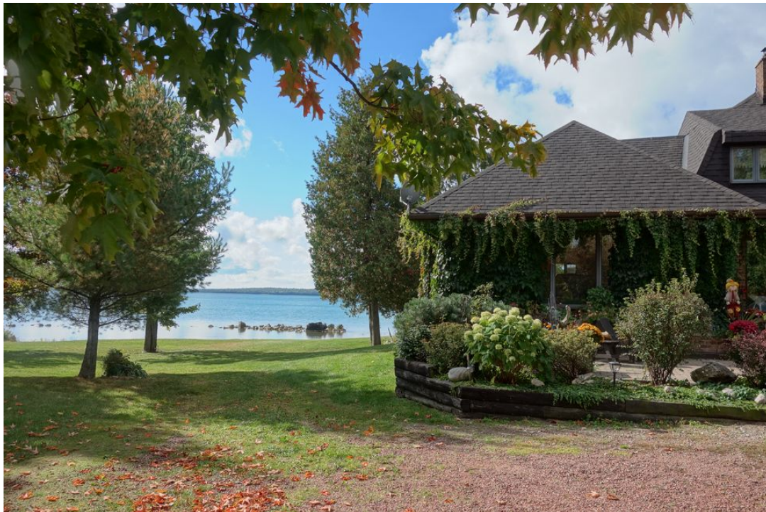
Abb. 05 Liebevoll gepflegter Garten