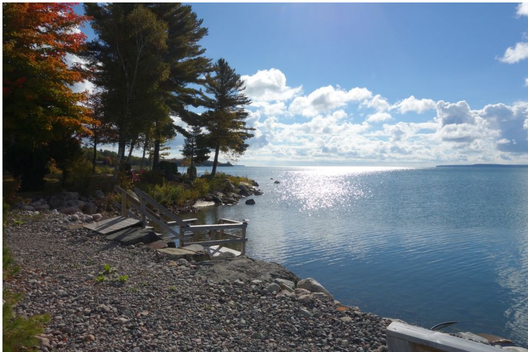
Abb. 08 Einstieg am Kiesstrand