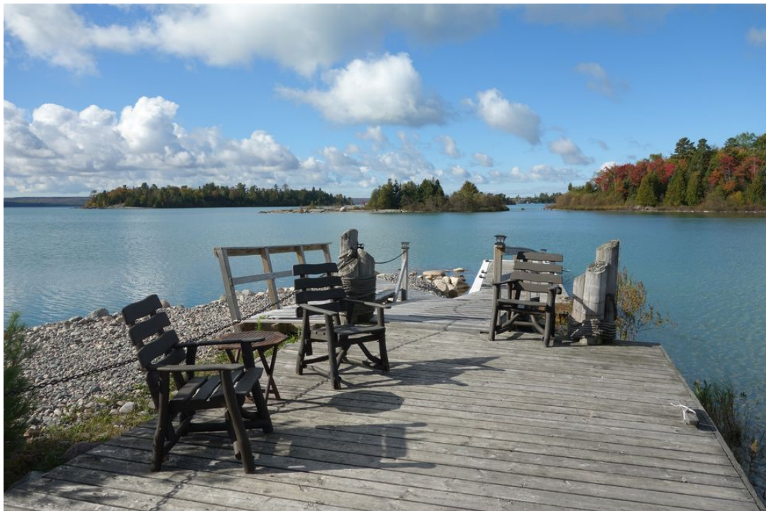
Abb. 10 Privater Anlegeplatz für Boote und Wasserflugzeuge