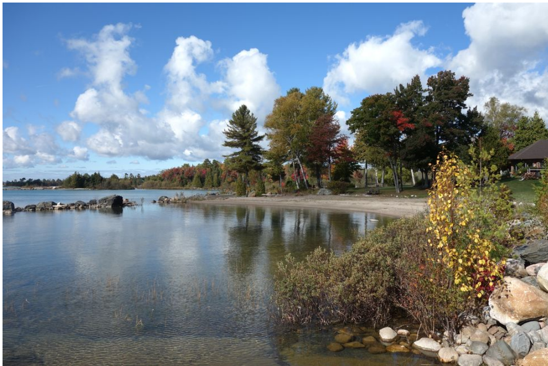
Abb. 06 Lake Huron - Canada live