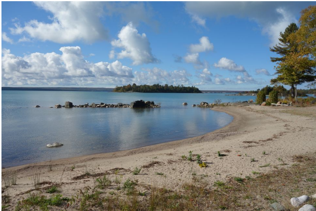
Abb. 09 Privater Sandstrand mit spektakulärer Weitsicht