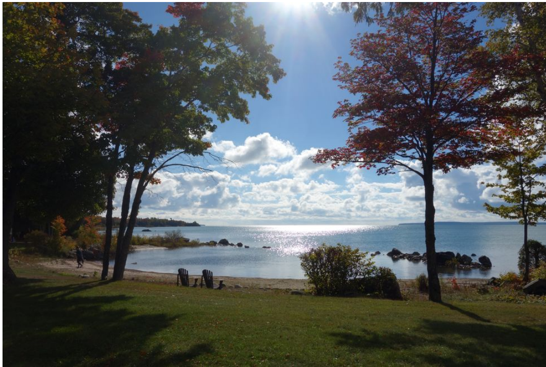
Abb. 07 Naturspektakel