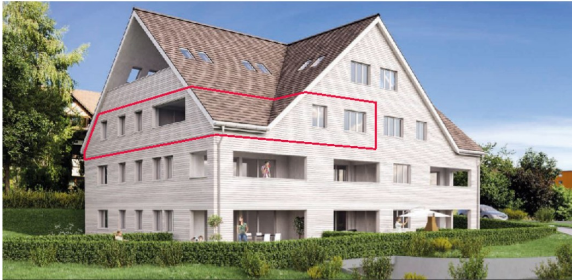
Abb. 01 Gekennzeichnete 4.5.-Zimmer Wohnung