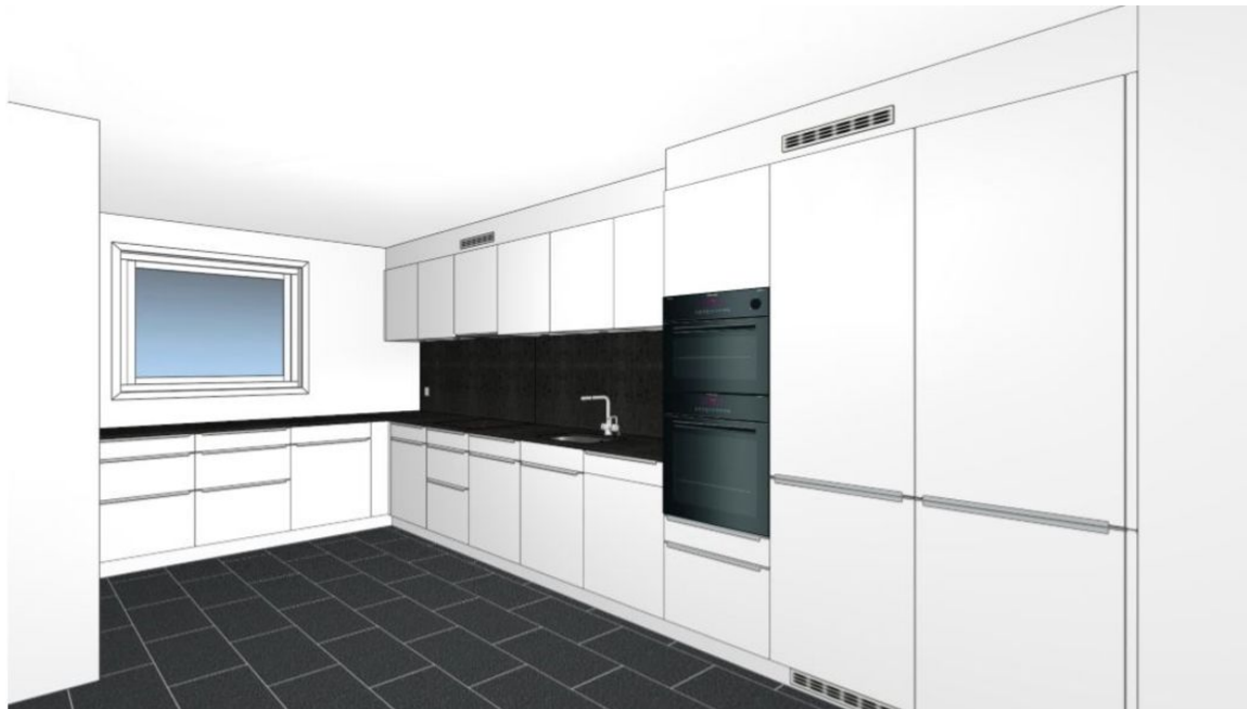
Abb. 02 Zeitgemässe Küche mit direktem Ausgang in die Loggia