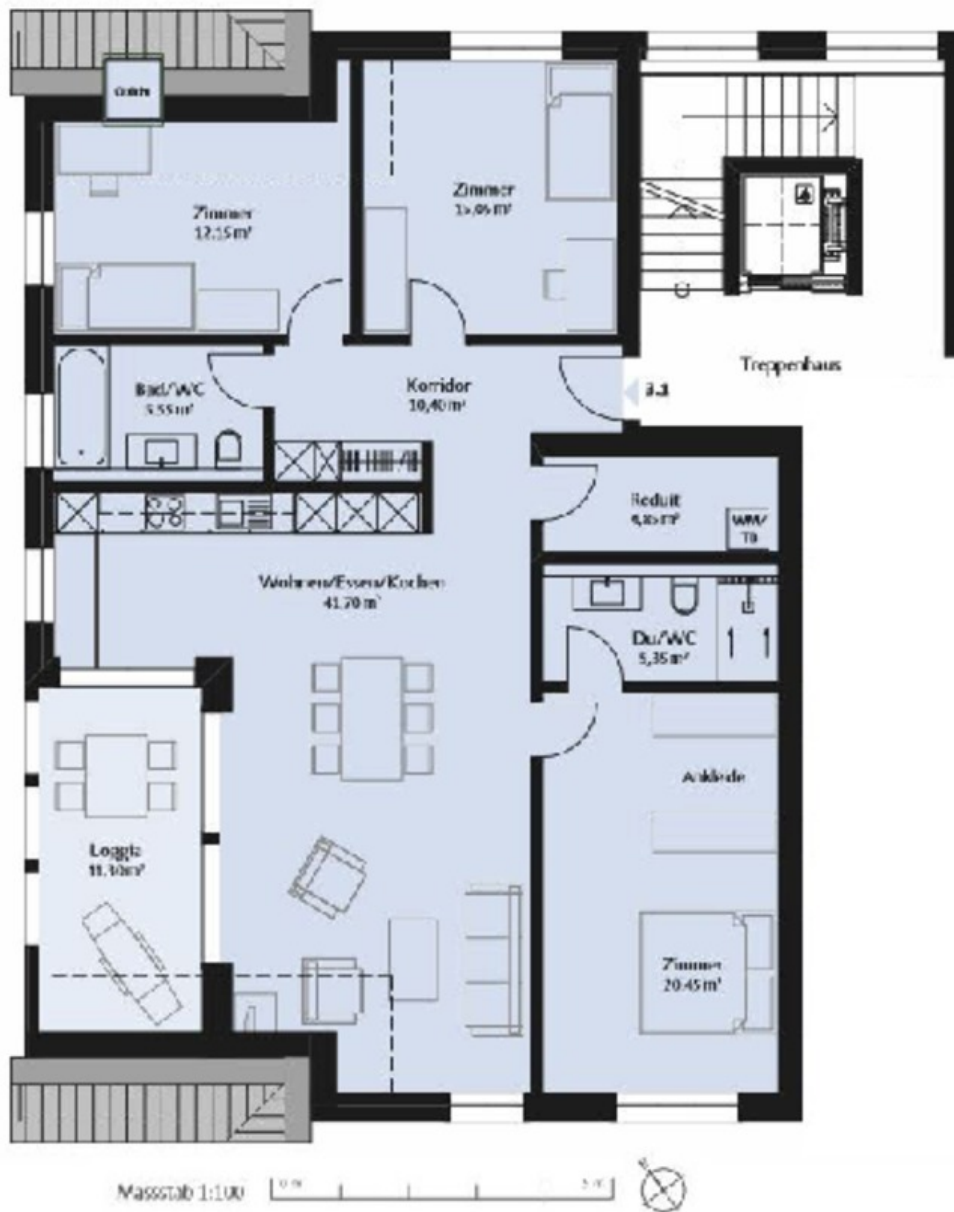
Abb. 03 Grundriss